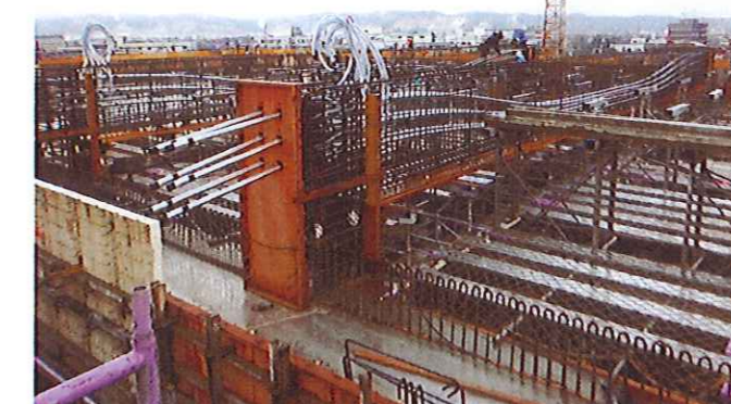
ワイヤー設置完了