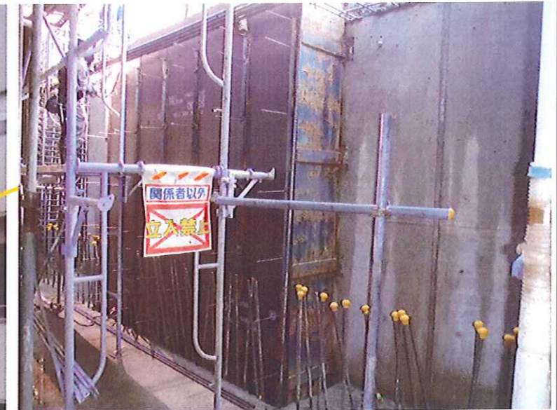
リアック室遮蔽鉄板