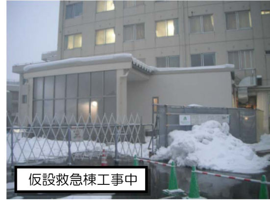
仮設救急棟工事中

【屋上防水工事中】 屋上では、雨水を防ぐため、防水工事を行っています。 屋上全面にアスファルトを染み込ませたシート状のものを220度前後に熱したアスファルトで張り付けていきます。