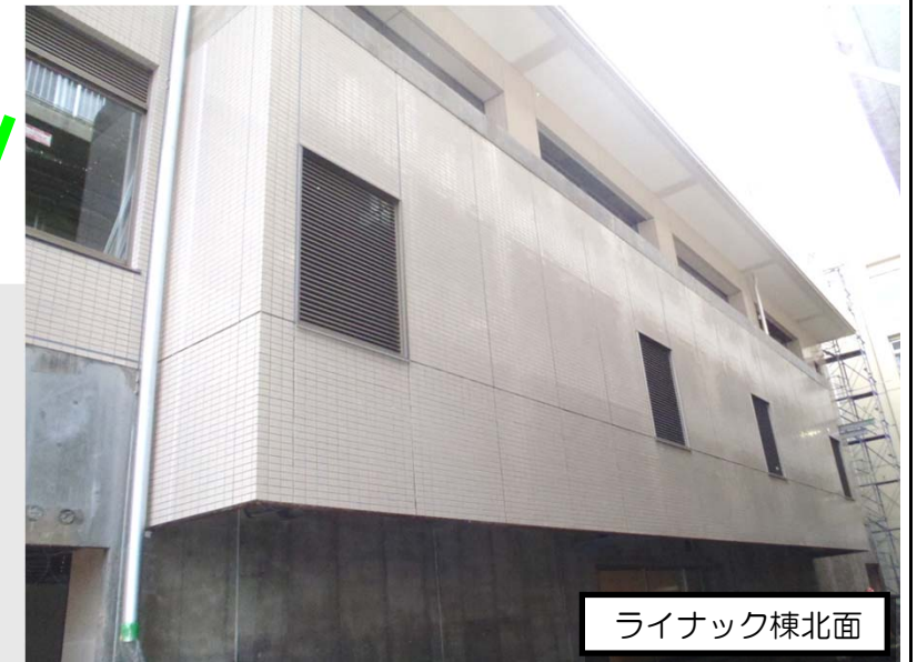
ライナック棟北面

【ライナック棟北面】 ライナック棟北面では、タイル張りが完了し、外部足場の解体を年明けに行いました。その後土間の整地を行い、仮設救命救急と繋がる鉄骨の建方を行っています。 (写真右上)