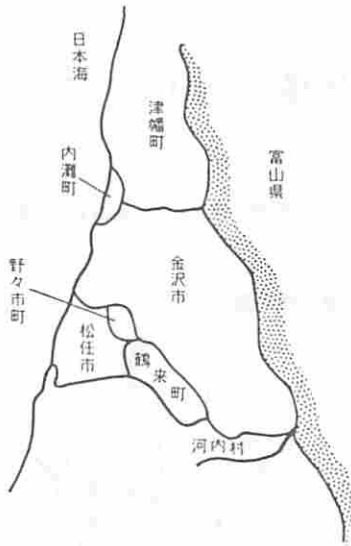
図3 金沢市及び周辺