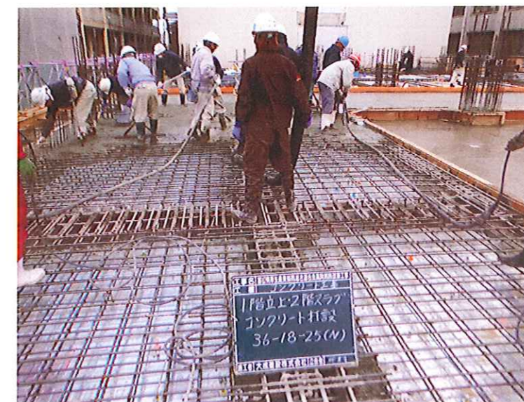
コンクリート打設状況