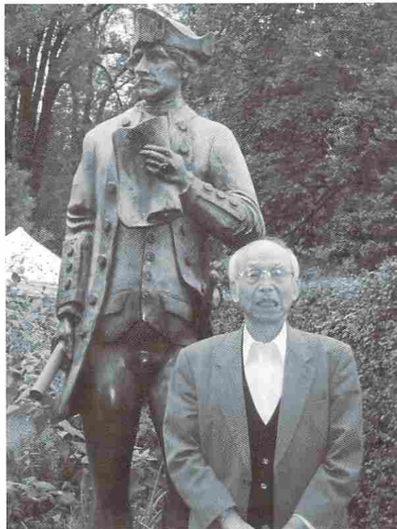
写真4. キャプテン・クックの銅像と筆者