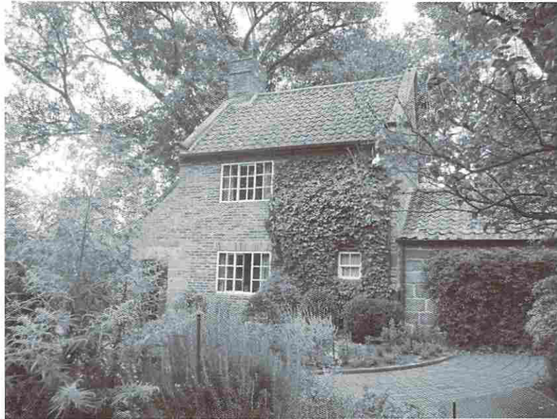
写真3. キャプテン・クックの家

いうことだろう。そのためもあってか、健康や運動に対する意識も高く、スポーツや健康のための施設も多い。メルボルン市内に Public Bath（公共浴場）と書いてある施設があった（写真5）。私も利用してみたが、それは日本で言う風呂ではなく、一種のプールであった。様々な人々が、思い思いにそのプールを利用しており、飛び込みも