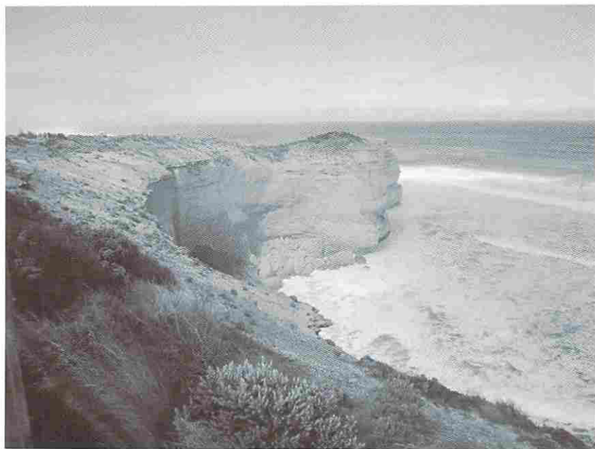
写真1. グレートオーシャンロードの海岸

リスのグリニッジ海軍病院の院長に推挙されている。彼が上陸した海岸はシドニー近くのボタニー湾（植物学湾）とされるが、その時、同行した博物学者たちは、オーストラリアの植物相と動物相を観察し、最初の科学論文を記載出版した。しかし、そうした状況に飽き足らなかったキャプテン・クックは更なる航海を実施し、ハワイ島で先住民との争いで死亡したと言う。彼の、住民の声を聞かない強権的、英国的態度が先住民の怒りをかっ