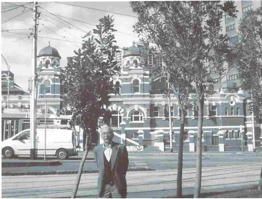
写真5. メルボルン市内の Public Bath（公共浴場）と筆者

可能であった。プールに入ると、あまり暖かなく、足がつかないほど深かった。子供たちはシュノーケルを使って遊んでいた。日本での海水浴に近いものを感じた。この施設では、希望者には健康相談や食事指導の取り組みもやっているようで、成績優秀者の名前が記載されていた。