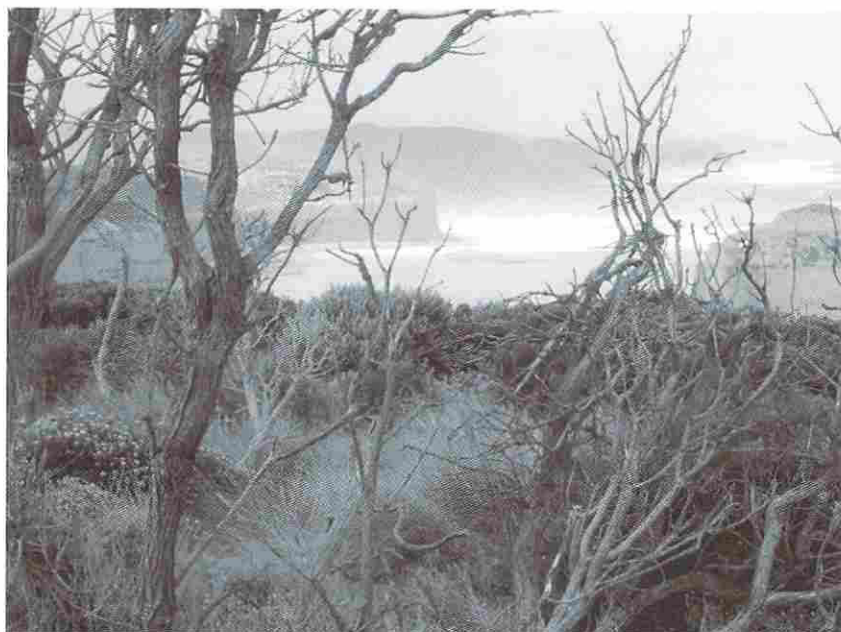
写真2. グレートオーシャンロード付近の植生