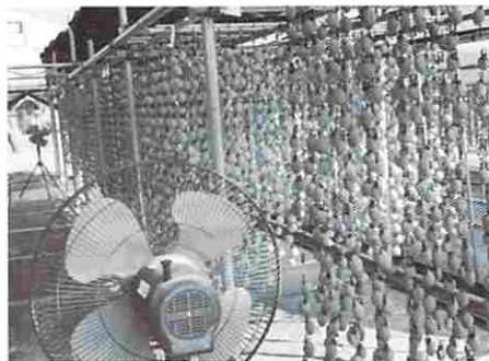
ビニールハウス内で通風乾燥