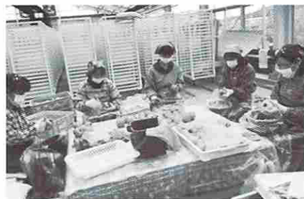
JA蜂屋支店では，若手が集団で手ムキ