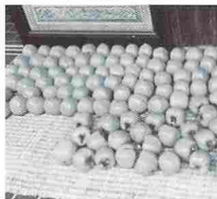
収穫後，日光で追熟