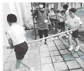
竿に吊るし乾燥場所へ