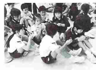
楽しみにしていた試食