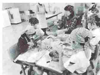
ボランティアの指導で皮むき