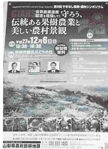
世界農業遺産登録を目標にシンポ