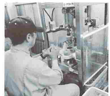
ヘタ取り機と皮むき機を統合