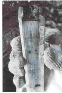
伊自良柿に適した皮むき器