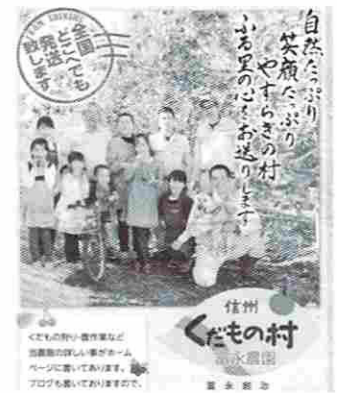
家族総出で果樹園を経営