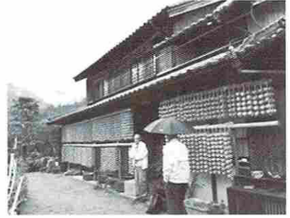
伊自良連柿の吊るし

蜂屋柿が認定されたこともあり、1000年の伝統を守るという意志は強い。後継者難が最大の課題である。