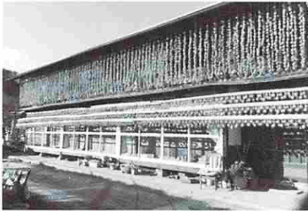
観光バスを受け入れる岩波農園