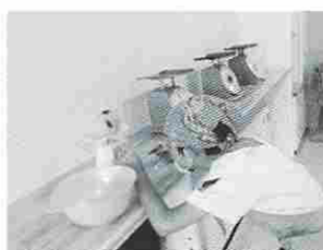
乾燥前の重量を測定