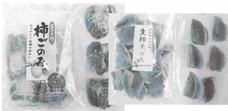
富山干柿の半割乾燥の新商品