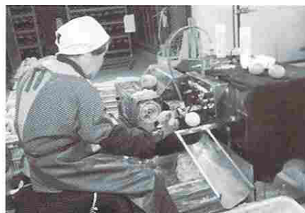
ヘタ取り機と皮むき機を隣接