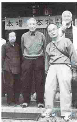
高齢でも蜂屋柿を守る (86・85歳)

販売の受け付けは，平成27年度は，12月1日であるが，高額でも手作りの生産量が限られているので，例年殆どその当日で完売になるほど人気が高い。蜂屋柿の加工法については，2002年に訪れた時と殆ど変わらない伝統を守る加工法が続けられている。2007年に，食の世界遺産「味の箱舟」に