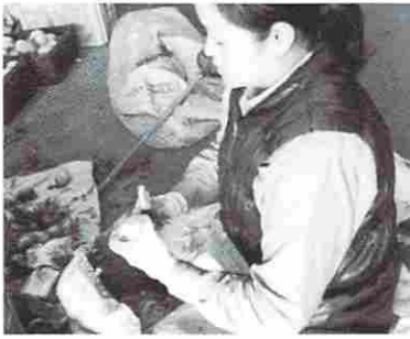
品種：「伊自良近江」は砲弾形で150g程度