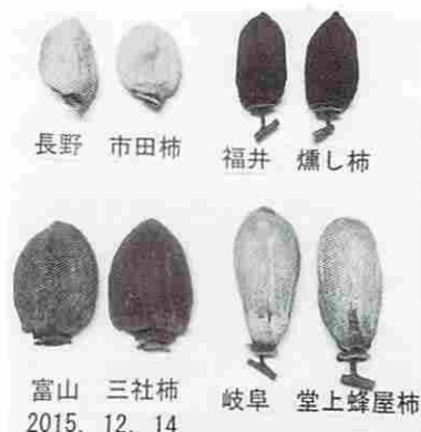
長野 市田柿 福井 燻し柿 富山 三社柿 2015. 12. 14 岐阜 堂上蜂屋柿