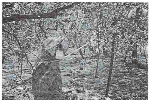
写真9 : リンゴ人工授粉 マスクをしている作業者 小杉町土代 2001. 4. 23