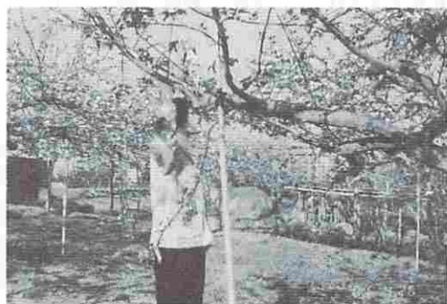
写真8：リンゴ人工授粉 首に掛けているのはエアースンプラー