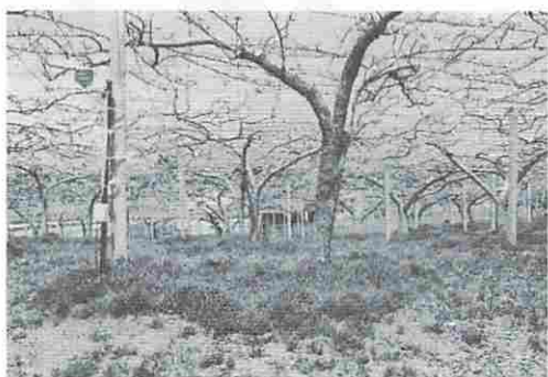
写真6：ナシ開花時期の下草(スズメノカタビラ)開花時期が重なる。