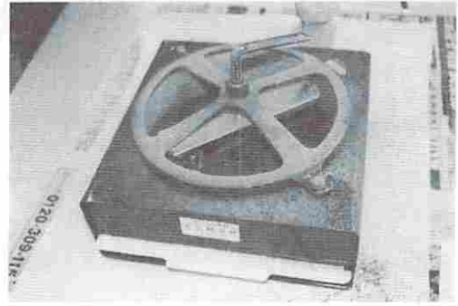
写真2：作業後、精選機に付着した石松子と葯

作業者が直接、吸引する胸付近のナシ花粉量は、周辺に飛散している量に比べ12倍以上に達し、下草のスズメノカタビラ花粉量もナシの半分近くに相当した。ヒカゲノカズラについても、ナシ花粉量と同程度吸引している