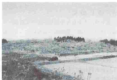
写真7：小杉町土代のリンゴ園と周辺 開花時期2001. 4. 23

15.5℃、湿度35%、風速0.1m/s)の「ふじ」満開日に、小杉町土代のリンゴ園で羽毛棒(梵天)を使用して、ナシの場合と同様に歩きながら一つ一つの花に授粉する作業をおこなった。(写真7. 写真8.) ナシの場合と異なり、花粉の増量材は使用していない。その作業の時に飛散した花粉を、同サンプラーで捕集した。サンプラー3台を、作業者が首に掛けた位置、授粉樹木の主幹の位置および授粉樹木から10mの位置に設置し同時捕集した。同果樹園の下草管理としては、多品目の畑作作業もあり、省力化のために除草剤を散布しているので、雑草は少ない。