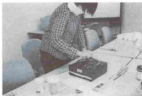
写真1: ナシ花粉の増量・精選作業 首に掛けているのはエアースAMPLER

2001年4月17日に, 北陸電力呉羽試験農場で花粉の増量・精選の室内作業をおこなった。作業1回につき, 開葯した葯100ccに, 増量材として100ccの染色した石松子(ヒカゲノカズラの孢子)を加え, 手動式精選機(ミツワPS-2)を使用して作業をおこなった。その作業の時に飛散した花粉を, パーソナル・エアースAMPLER(英国, バーカード社製)で捕集した。サンプラー3台を, 作業者が首に掛けた位置と, 精選機から0.8mと3m位置に設置し同時捕集した。(写真1.)