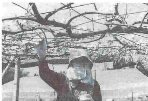
写真5：ナシ人工授粉 タオルでマスクと日焼け防止を兼用 2001. 4. 18

22℃、湿度36%、乾燥注意報、風速3 m/s)に、北陸電力呉羽試験農場ナシ園で羽毛棒(梵天)を使用して、歩きながら一つ一つの花に授粉する作業をおこなった。(写真5.)その作業の時に飛散した花粉を、同サンプラーで捕集した。サンプラー3台を、作業者が首に掛けた位置、果樹園中央および果樹園端の位置に設置し同時捕集した。同果樹園の下草管理としては、除草剤を使用せず、出来るだけ頻りに機械で除草をしている。それでも他のナシ園同様、イネ科のスズメノカタビラが繁茂し易いので(写真6.), 土壤養分を兼ねたナギナタガヤによる草生管理の試行を2000年から始めている。