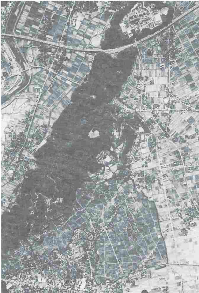
写真10: 富山市呉羽丘陵西側と平坦部に広がるナシ園とその周辺 1995. 11. 19

現在のところ, 人工授粉に伴う暴露する花粉の影響が, 果樹業者には必ずしも充分認識されていない, マスクなどの対策をしていない業者も多い。2001年11月に, 筆者らは農学の果樹生産の立場からの環境調査に加えて, 公衆衛生学の視点からの人への健康影響調査を加えたアンケート調査を開始した。今後, さらに果樹生産と人間生活が共存するための総合的な環境情報を得るために調査を続ける所存である。