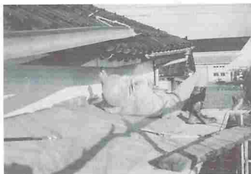
図5 雪で折れた庇を自分で修理する兄

電気技術者の兄は「百姓とは百の姓、つまり百種類以上の仕事をする者」と言う。新築の車庫の屋根瓦を自分で葺く。また、農業機械の修理等、溶接機等を使って、全て自分で行う。