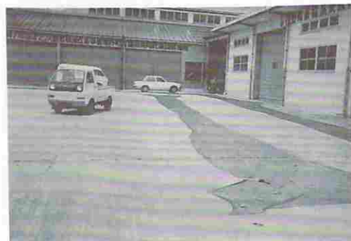
図3 農協の共同乾燥所にて中古漁網を裁断する (昭和60年6月10日)