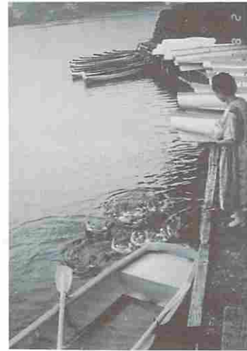
図7 観光用にもらわれて行った桜ヶ池の合鴨達 （昭和60年8月2日）

（昭和60年NHKのインタビューに「合鴨は一鳥多石です」と明快に述べている。昭和60年合鴨の一部は観光に近くの桜ヶ池にもらわれていった。「ビヨビヨ来いよ〜」と呼ぶと覚えているのか、すぐに寄ってきた。）