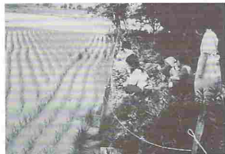
図11 合鴨観光に来た見しらぬ人達

（昭和60年に始めた年から見しらぬ人が合鴨観光に来た。この時、すでに合鴨が飼主を忘れないように、毎日餌をやらなければならないとしている。）