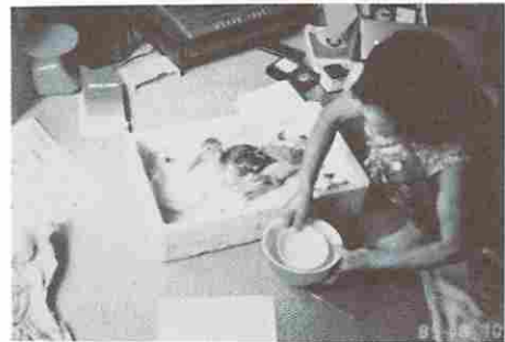
図12 除草を手伝ってくれた頻死の合鴨を必死に看病する母

(ケガをし、頻死の状態になった合鴨を、自分の子供のように必死に看病する母。昭和60年8月8日)