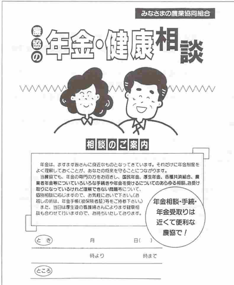
図2. 農協がおこなう年金、健康相談チラシ