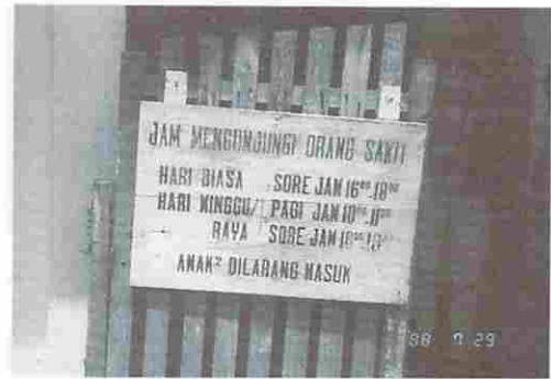
図11 簡単な病院の案内板(産婦人科と小児科)

翌29日はいよいよスラウェジ島とも別れである。空港へ赴く途中、市内の一角で公立病院の一つを訪問する機会を得た。玄関口の案内板であるが至って簡単なものである。(図11) 同じく図12は廊下に展示してある業務案内で、言葉よりも絵で分かるような工夫がさ