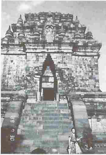
図16—(2) ジョクジャの寺院(2)