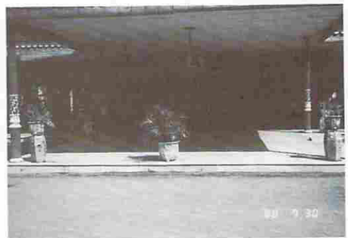
図18 王宮の接客の間

王宮内の観光巡路は清潔に保持され清掃も行き届いていた。図18の「接客の間」は靴を脱いで入ることが義務付けられている。王宮そのものは1756年に建築された建物であり、当時のジャワ建築の粋を集めていると言われる。部屋は数多く配置され、歴代のサルタンの肖像などの陳列もあり、クリスと呼ばれるジャワ独特の短刀や衣装、乗り物、時計、家具調度品などの展示室もある。一室ではジャワ伝統の民族衣装を身につけた老人たちが目に着いたが、彼等は此の王宮を警護する「武士」たちだということで、腰にはクリスを帯