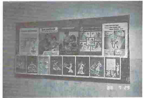
図12 絵を中心とした病院の業務案内 (病院廊下にて)