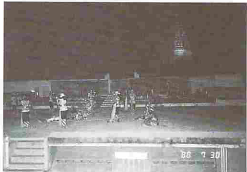
図21-(1) ラーマーヤナ舞踊劇中の一場面(1)

図20はその際の購入チケットで、裏側には当日分の簡単な解説も印刷されていることが分ると思う。料金は一人分8,000ルピア(日本円にして約800円に相当)であった。図21-(1),(2)は劇中のスナップで広大な舞台に100人を超す踊り手一大人も子供も出演する一が所狭しと活躍する情景はカラフルな衣装などと合わせ異国情緒を十二分に堪能させるものであった。