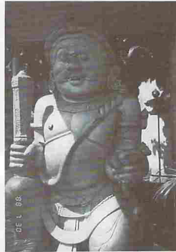
図17 王宮入口の守護神 (入口の左右に置かれている)

守護神が左右一対となって入口に置かれ王宮の安全を守っているというわけである。(図17)