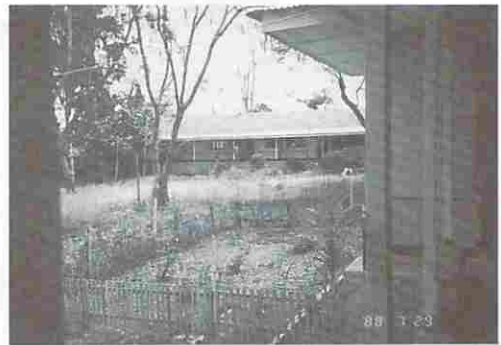
図13 裏手から見た病院の全景

れている。又図13は裏手の方から眺めた全景で勿論平家木造建築である。図14—(1), (2)は病室内の風景で、入院の状況、見舞客など日本の同種病院と似たりよったりであるが、日本のような保険制度はなく自由診療が主体のようで、可成り高額な費用となるような説明であった。従って利用者も割合と少なめということであったが、受診制度上の問題以外に近代医療そのものに対する認識の有無にも施