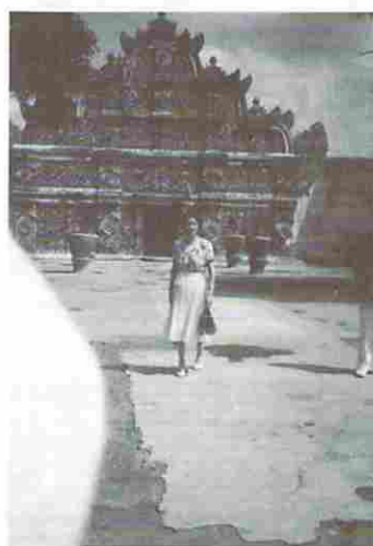
図16-1) ジョクジャの寺院(1)

ジョクジャはインドネシアの京都と呼ばれているとか、事実京都市と姉妹都市縁組を結んでいると聞いたが、ジャワ文化発祥の地として知られ、7～9世紀には仏教文化が見事な華を咲かせ、続いてヒンズー教文化が隆盛を極め、それらの文化的遺産としてポロブドール寺院を初めとして多数の寺院が近くに散在しており、これらを観光巡路に入れると、それだけで2～3日を予定しなければならぬとされる。図16-1)、2)、3)は数例を挙げ