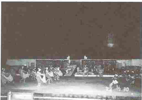
図21-(2) ラーマーヤナ舞踊劇中の一場面(2)