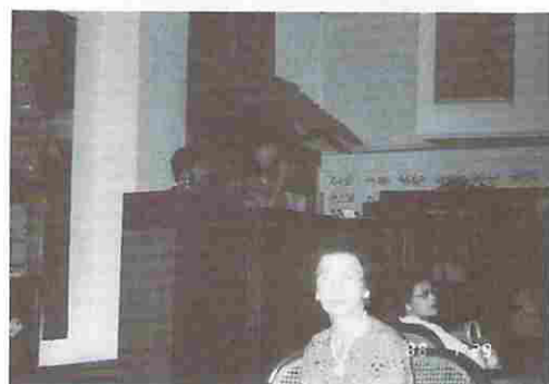
図15 女声ソプラノ生演奏 (髭の横顔はピアノ伴奏者)

ピアノ伴奏と共に覚えのある歌声が響いて来た。これは「恋人よ」、続いて「スバル」。図15を御覧下さい。生演奏の女声ソプラノに元気回復の一行はホテルの好意を胸に、それぞれの部屋へ散って行ったのである。