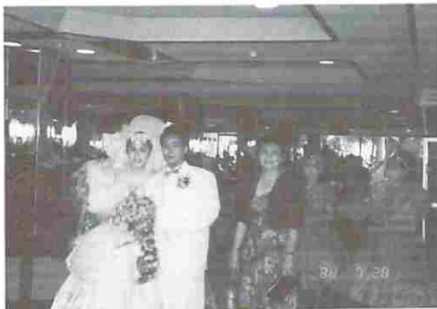
図10 インドネシアにおける婚礼衣装

帰ってから Hotel のロビーで休んでいる時、何となくザワザワとした気配に階段を見ると婚礼を行うカップルが降りてくる処、許しを得てのスナップ(図10)でイ国での婚礼衣装、美容師、介添の少女などの様子が伺われる。