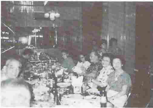
図7 中華料理店にて

昼食時、同店にて日本からの日本語の教授に來ているという先生に會った。概要は大体3~6カ月講義し、一旦日本へ帰り再度イ国して講義を続けるということ、この先生は川崎市から技術協力として参加しているとのこと。