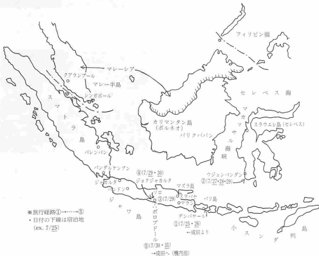
図2 インドネシア周辺と旅行経路