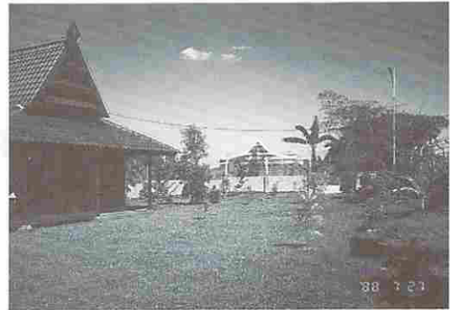
図3 富山村の「友好の館」

豊田パーティー一行の面々は新装早々の「友好の館」の一室で医学部の先生方の準備された朝食の御馳走に与かりながら改めて自己紹介、これまでの経緯の概要、明日の学術交流会打合せなどを済ませ敷地内を見学した。図4～6はその折りのスナップである。時刻は