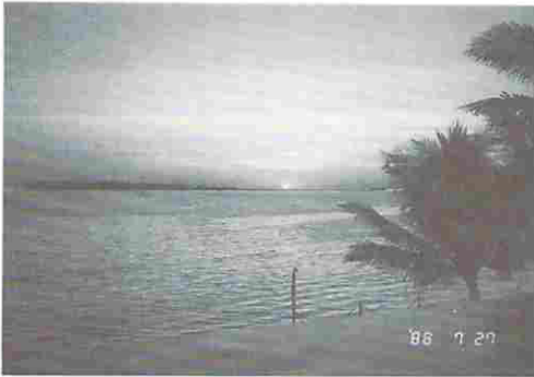
図9 ロサリービーチの日没 (世界3大日没光景の1つとか)