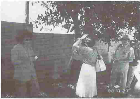
図6 富山村の敷地の一部、木蔭にて