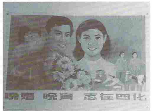
晩婚晩育のポスター

街を通ると「晩婚晩育、志在四化」のポスターが屢々眼につく。志在四化とは国民に対して工業、農業、国防、科学技術の近代化と