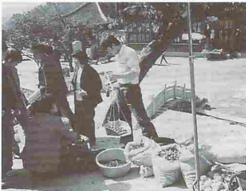
野菜の自由販売（北京市内）