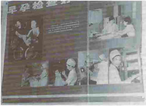
早孕検査のポスター、早く中絶の奨励

いう意味で、晩婚晩育はその字の如く、人口増加の抑止策の周知徹底に躍起となっている。