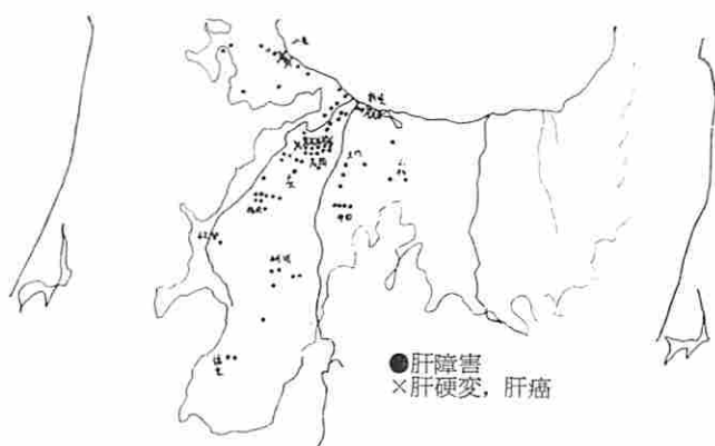
図表 1 肝疾患入院患者の地域別分布状況