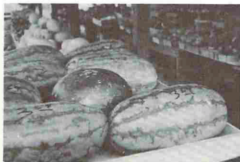
第7図 この西瓜 800円

金沢の姉妹都市バッファローの都市提携委員会の招待をうけた。フライヤー委員長のいうには「日本は牛肉は非常に高いそうだからアメリカにいるうちにたらふく食べて帰ってほしい。」出されたのはワラジ大のビーフステーキである。たしかに有難いが、折角のごちそうも半分平らげるのにやっとだった。とにかく円高ドル安で、自分のふところ勘定で食料品が安くみえて仕方がなかった。日本からの観光客が激増するのは無理がない。黒部西瓜が800円位、メロンは80~100円、カリフ