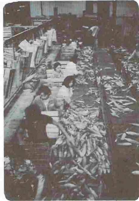
第3図 「とうもろこし」の選別場 メキシコの収穫労働者

集荷場と機械工場をも見せられた。これだけの大農場だから広大なものである。トウモロコシ（食料用）の選別をしていたが、大き