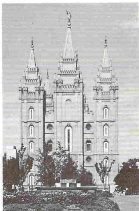
第5図 モルモン教大本山 (ソルト・レーク・シティ)

安住の地を求めたのである。信徒は、全世界に 400万といわれている。特異なことは、信者は永い間一夫多妻主義で、地位、社会的力量により妻の数も異なるといわれ、ヤングも 27人の妻をようし、そのうち19人の妻から 56人の子供をもったと伝えられている。しかしアメリカの法律により現在はその慣習はない。この荒蕪の砂漠地帯にヤングの才幹と統率力により灌漑農業により馬鈴薯栽培に成功し、モルモン教の大本山を建立するに至った。そ